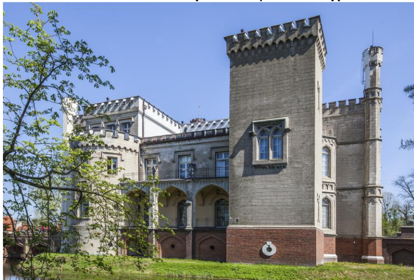
Zamek Kórnicki - elewacja zachodnia po renowacji