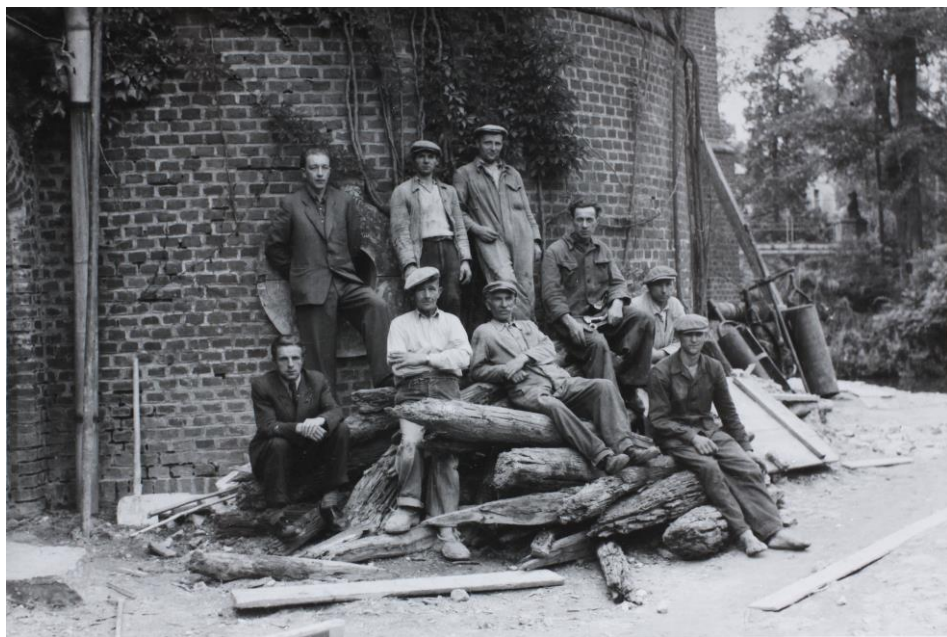
Usunięte pale drewniane, Zamek Kórnicki ok. 1948 r. (nr inw. - Fot. 7311)